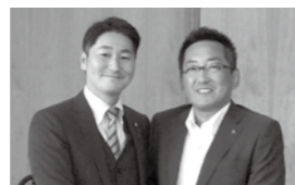
▲各務原市・浅野健司市長（右）と橋本町長

各務原市にてふるさと納税研修会を実施 ふるさと納税に早くから力を入れて、岐阜県・各務原市を訪ね、研修会に参加しました。利用者増加のための施策を伺い、今後の「境町ふるさと納税」への課題を浮き彫りにしました。