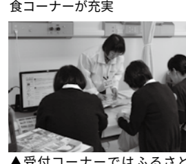
▲受付コーナーではふるさと納税の申し込み受付を実施