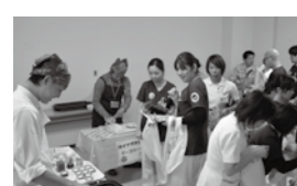
▲常陸牛やチーズケーキ等試食コーナーが充実

西南医療センター病院でふるさと納税PRキャンペーン 西南医療センター病院にて、職員の方を対象とした、ふるさと納税PRキャンペーンを実施。お礼の品の参加商店による、試飲・試食や無料配布、販売などを展開。ふるさと納税の受付も実施し、町外から通勤している職員の方を対象に、ふるさと納税の仕組みについての説明や、お礼の品の紹介などを行いました。