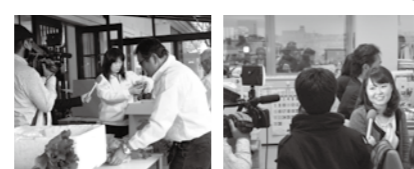
▲道の駅さかい（左）や担当者のインタビュー（右）等、取材・撮影が行われました

テレビ朝日「モーニングショー」で境町お礼の品が紹介 テレビ朝日の朝の番組「モーニングショー」の取材を受け、「年末駆け込みふるさと納税お得攻略」と題し、境町が取り上げられました。スタジオでは、境町のお礼の品4点が紹介されました。放映後は、問合せや申込みが殺到し、1日で1000万円以上の寄付が集まりました。