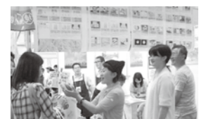
▲にぎわいを見せる境町ブースでは、常陸牛の試食会も

「ふるさと納税大感謝祭」に出席し、境町をPR! 東京・品川にて開催された、「第1回ふるさと納税大感謝祭」に境町のブースも出展。境町の取り組みや紹介、お礼の品の一部販売や試飲・試食、セグウェイ試乗体験などを行い、境町を広くPRすることができました。