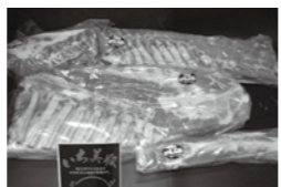
▲寄付金5万円のいち美豚セット

お礼の品に2万円以上の高額寄付を追加 境町ふるさと納税の寄付金は、1万円を基本としています。お礼の品ラインナップの中に、2万円、3万円といった高額寄付の品数も増やし、寄付金の増加に努めました。