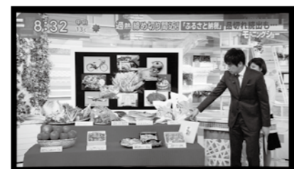
▲スタジオで、境町のお礼の品の紹介も。常陸牛やコシヒカリの豪華さが注目を浴びました