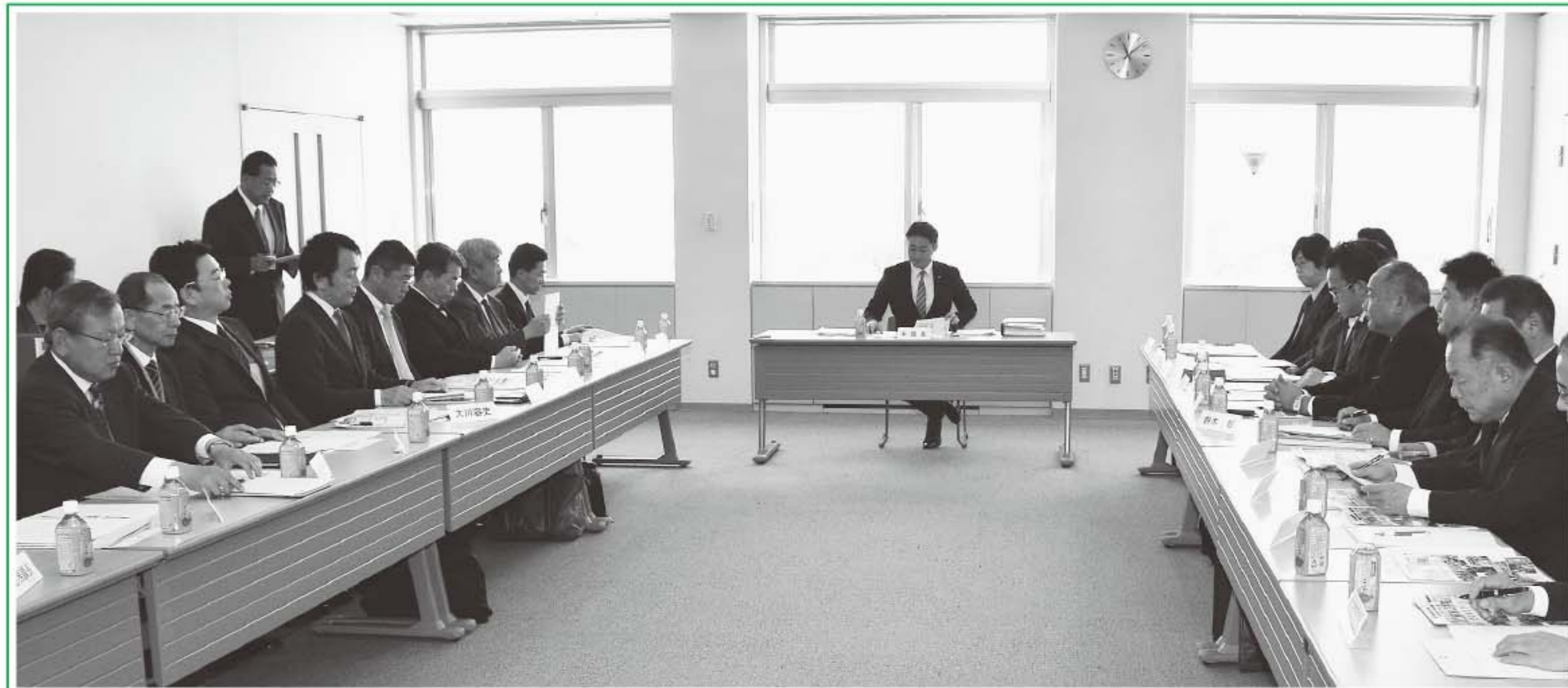
▲「境町まち・ひと・しごと創生本部」の様子