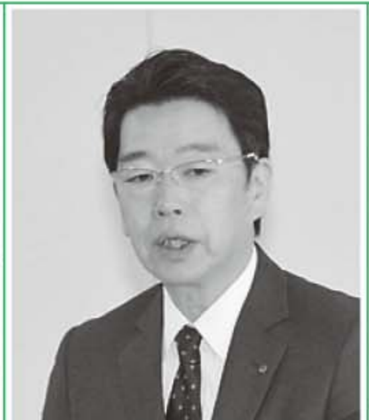
▲常陽銀行境支店の大川支店長