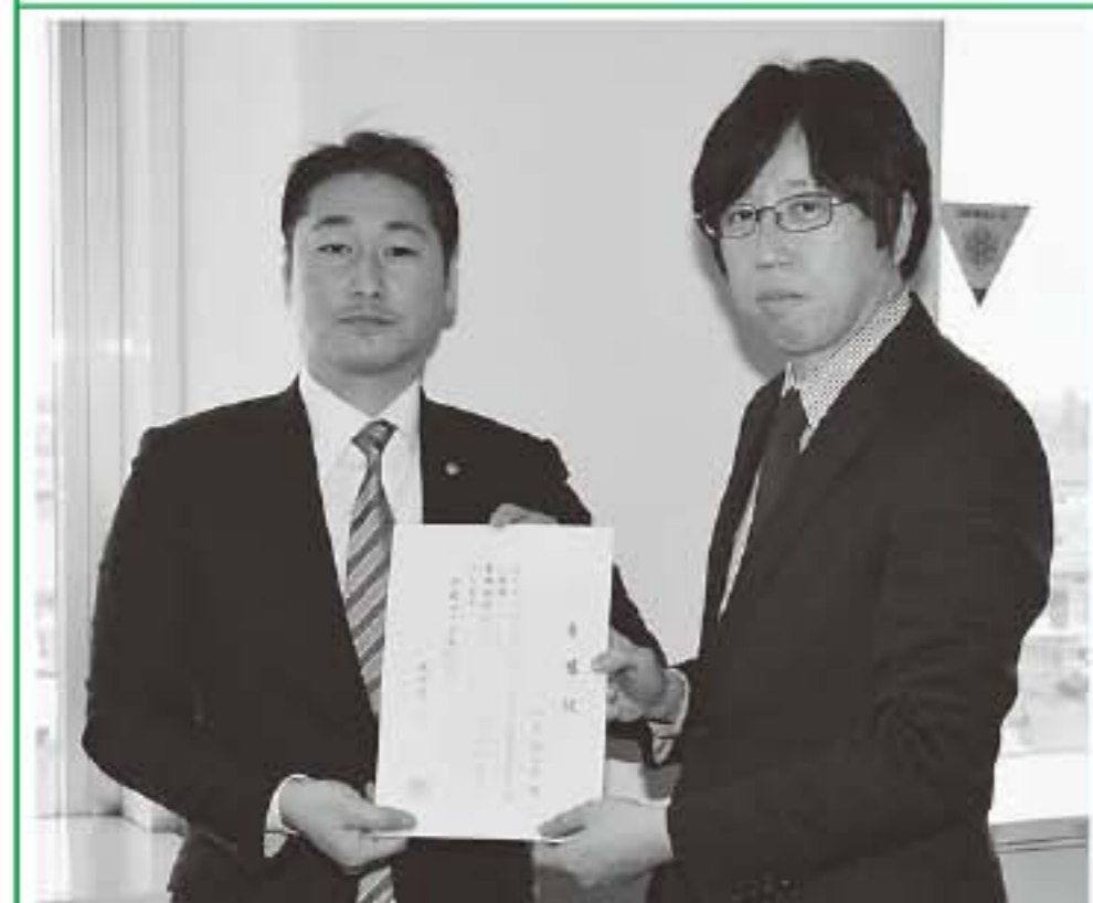
▲代表して委嘱状を受け取る明治大学の牛山教授（写真右）