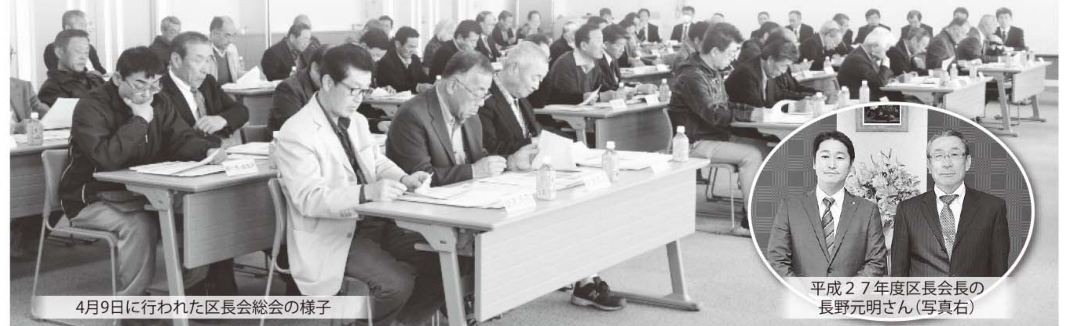
4月9日に行われた区長総会の様子

平成27年度の新区長さんが決まりました。区長さんには、住民と町のパイプ役として住みよい町づくりのためにご活躍いただきます。