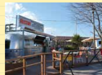
▲アメリカ西海岸をイメージしたオープンテラス

道の駅さかい敷地内にサイクリスト応援カフェ「CORG's (コーグス)」がオープンしました。サイクリングロードのある堤防上から直接乗り入れられ、ホットドックやスムージーなどの飲食販売や自転車の貸し出し、シャワーなども備えており、サイクリングの休憩場所として、多くの方で賑わっています。