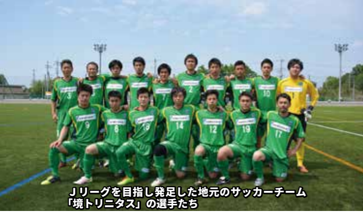
Jリーグを目指し発足した地元のサッカーチーム「境トリニタス」の選手たち