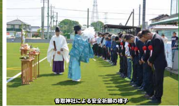
香取神社による安全祈願の様子