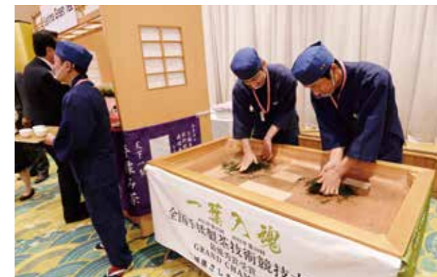
レセプション会場にて伝統的な手もみ製茶技術を実演

また、「手もみ茶」は、渋みを減らし、うま味成分を増やすため、紫外線よけのネットをかぶせ葉の光合成を抑えるなど、丹精込めて育て、収穫された茶葉を使用し、焙炉と呼ばれる台の上で直接手で茶葉を揉み、およそ6時間という長い時間をかけて乾燥・焙煎を行う手法です。その味は伝統的な製茶技術に裏打ちされた、まるでだしのような深いうま味に溢れています。