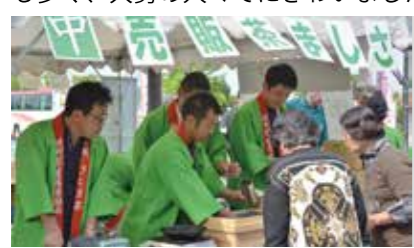
◀さしま茶新茶販売の様子。26kg用意された新茶は昼前に全て完売

初めて茶摘みを体験した方からは、「摘んだ茶葉で自家製のお茶を作りたい。」などの声が聞こえ、思い思いに楽しんでいました。会場は県外など遠方からの来場者も多く、大勢の人々にぎわいました。