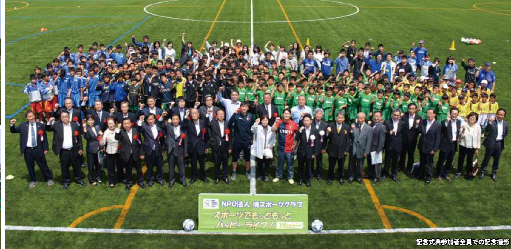
NPO法人 境スポーツクラブ スポーツでもっともっと ハッピーライフ!