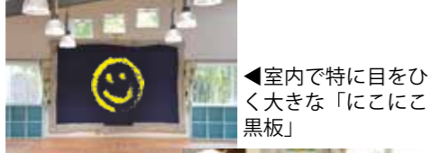
◀室内で特に目をひく大きな「にっここ黒板」