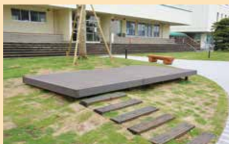
▲文化村利用者の休憩スペースにもなるウッドデッキを設置