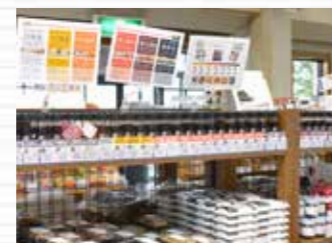
▲全国各地の商品が並ぶ店長セ レクトコーナーには31種類の 醤油など珍しい商品が並びます