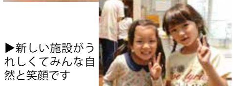
▶新しい施設がうれしくてみんな自然と笑顔です