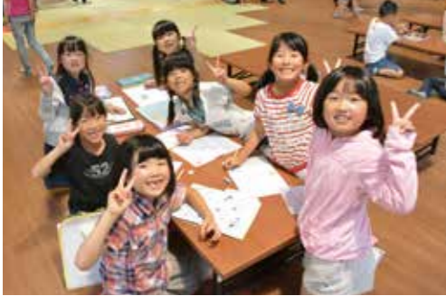
▲みんなでやれば勉強も楽しい♪