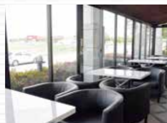
▲増設されたカフェスペースで はソファ席でゆったりと過ご せます