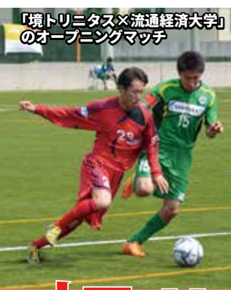
「境トリニタス×流通経済大学」のオープニングマッチ