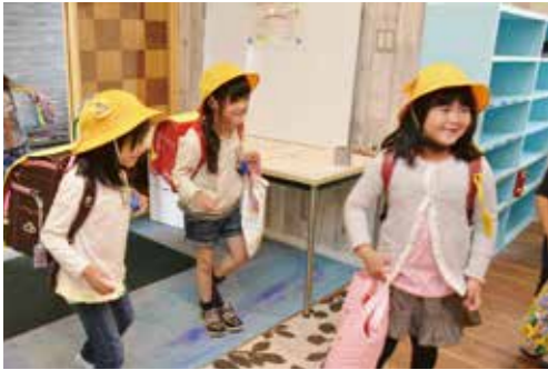
▲前よりもっと来るのが楽しみになりました