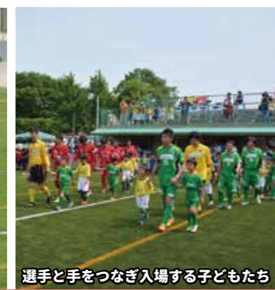
選手と手をつなぎ入場する子どもたち