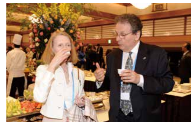
日本一に輝いた手もみの「さしま茶」を味わう様子