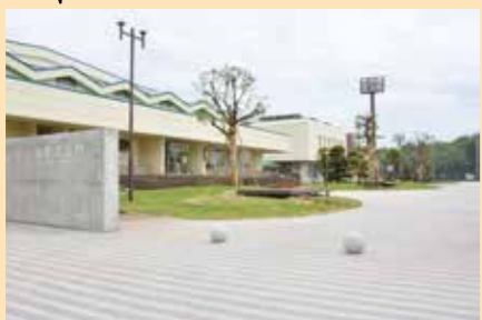
▲共用部の改修工事によって生まれ変わった境町文化村