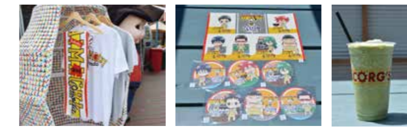
コラボグッズはTシャツ、タオル(左写真)、ステッカーにコースター(中写真)など。コラボメニューとして、プロテイン入りのさしま茶スムージー(右写真)も期間限定販売

グッズの販売期間は、第1弾が5月21日~6月19日、第2弾が7月25日~8月31日となっています。