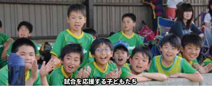
試合を応援する子どもたち