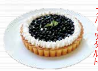
▲新鮮なブルーベリーを使用した 「ブルーベリータルト」 季節ごとにフルーツが変わります