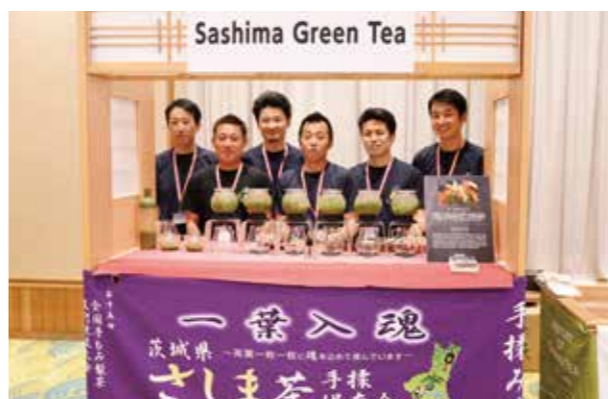
さしま茶手もみ保存会の皆さん