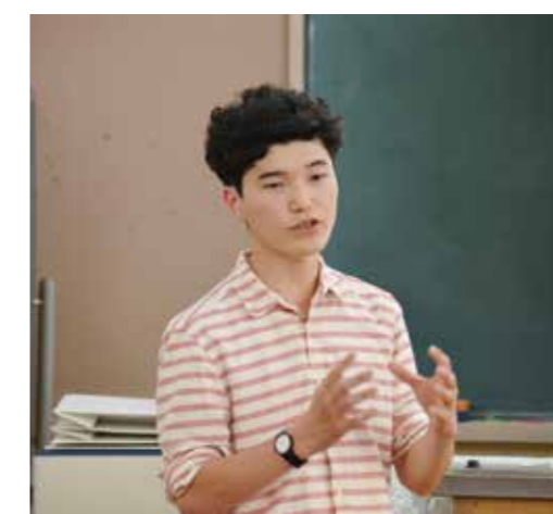
高校生たちに向け熱心に説明を行う場参与

8月16、17日に開催される高校生によるプラン提案イベント『境町高校生まちづくりアイデアソン』の説明会が5月26日に、境高校の生徒35名、6月9日には坂東総合高校の生徒26名に対して行われました。