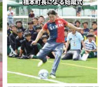
橋本町長による始業式