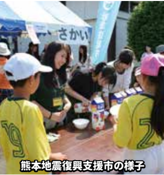
熊本地震復興支援市の様子