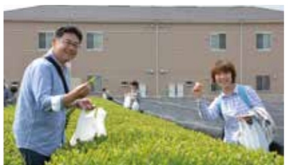
▶茶摘み体験を楽しむ来場者