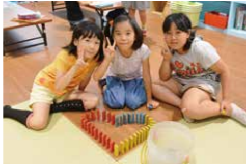
▲積み木でハートを作ってみました