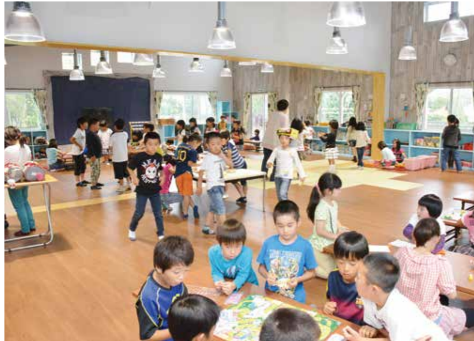
▲明るく開放的な室内で思い思いの時間を過ごす児童たち