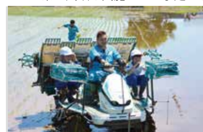
◀田植え機に乗り機械での田植えを体験する森戸小の児童たち

また、26日には猿島小学校全校生徒で茶摘み体験学習が行われました。石山茶園所有の茶畑で児童たちが茶摘み体験を行うのは今年で3年目です。10月には給食でのお茶の試飲も実施される予定です。