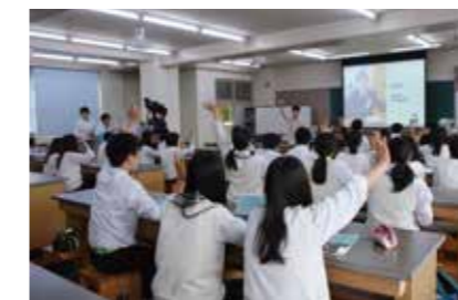
境高校での説明会の様子