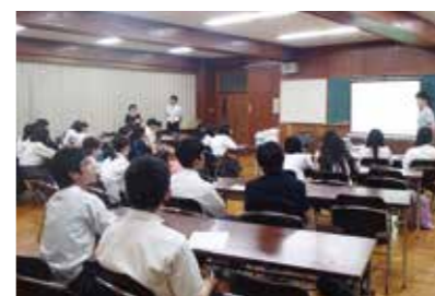
坂東総合高校での説明会の様子