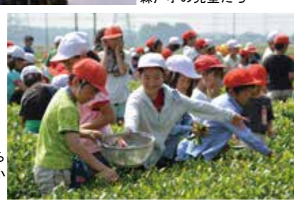
▶みんなで楽しみながら茶摘みを体験する猿島小の児童たち