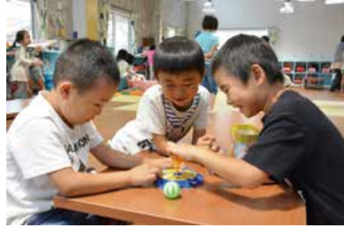
▲友達との時間はあっという間に過ぎます