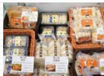
▲幻の豚「梅山豚」コーナー これだけの品揃えは全国でも道 の駅さかいだけ!