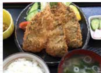
▲店長おすすめの新メニュー ボリューム満点「ジャンボアジ フライ」