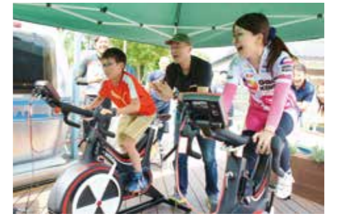
小川選手とお客さんとのワットバイクレースの様子