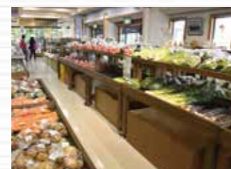
▲陳列棚を2段にすることで商 品が見やすく、取りやすくな りました