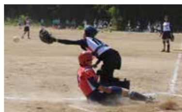
見事なスライディングを見た境一中の選手

境一中は激戦の末、決勝トーナメント出場は叶いませんでしたが、今大会はDeNA監督を勇退した中畑氏ご本人も5年ぶりに参加され、アントキの猪木さん率いる偽ジャパンの芸人さんとともに会場を盛り上げました。