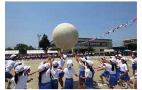
猿島小学校全校児童による「飛べ！大玉君！」

5月14日、町内5つの小学校で、また21日には、町内各中学校で運動会が開催され、児童生徒たちは、練習の成果を発揮し、最後まで全力で運動会を楽しみました。