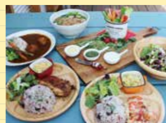
▲ガーリックシュリンプなどここでしか食べられない珍しいメニューも