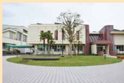
▲新たに敷かれたブロックはエコなリサイクル材料を使用