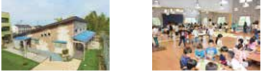
定員を70名→90名規模へ拡大!! より多くの児童が利用可能になりました

境小学校の児童が利用する「なのはな児童クラブ」の施設老朽化に伴い、新たに境小学校敷地内に定員90名規模の児童クラブ施設「ここにご児童クラブ」を建設しました。