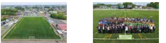
リニューアル後の利用者数21,439人(5/8～11/24) 大人気施設に生まれ変わりました!!

スポーツ振興くじ(toto)助成金を活用し、境町サッカー場の整備（人工芝生・LED照明器具設置）を実施しました。リニューアル後は利用者が飛躍的に増加し、大人気の施設になりました。