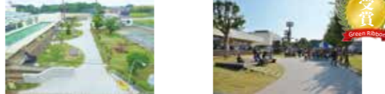
茨城県「まちづくりグリーンリボン賞」受賞!!

文化村の老朽化した施設内の道路改修にあたり、エコなリサイクル建材を使用して、開放感のあるにぎわいの空間へとリノベーションを行いました。また、この事業は茨城県が実施している「茨城県うるおいのあるまちづくり顕彰事業」において、景観に配慮した建築物の整備を行った者などを表彰する「まちづくりグリーンリボン賞」を受賞しました。 ※リノベーション・・・既存の構造をそのまま利用し、新たな機能や付加価値を付け加える改修工事