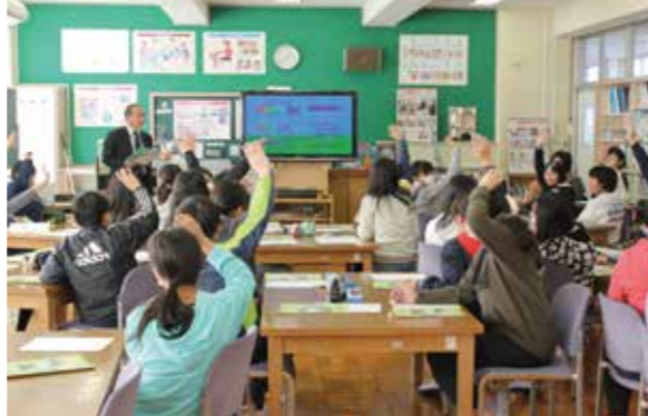
猿島小学校で行われた租税教室の授業風景

その他の小学校では町税務課職員が、中学校では古河税務署国税徴収官が講師を務めています。