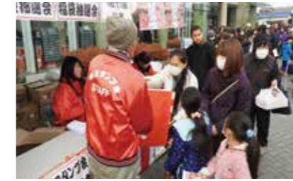
▲大行列ができた「境スタンプ会抽選会」