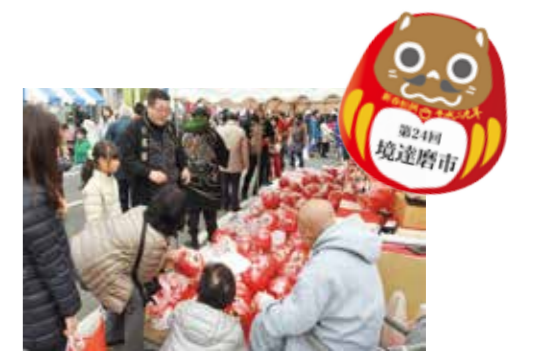
▲達磨を購入する来場者