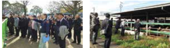
熊本城視察の様子 千興ファーム視察の様子

熊本県の日も早い復興を祈念し、町としても、今後とも継続的な支援を行っていききたいと思います。