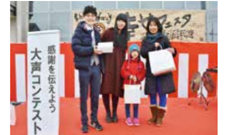
▲大声コンテストで入賞した皆さん