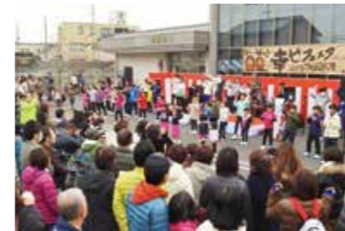
▲70名以上が参加した「恋ダンス」のフラッシュモブ

さらに、今年も婦人会、商工会女性部、商工会青年部の皆さんによって行われた豚汁と甘酒、おしるこの提供も大盛況でした。