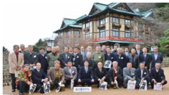
箱根町富士屋ホテルでの記念撮影

今回の研修は、小山町役場及び箱根町役場をはじめ多くの関係者にご協力いただき、大変有意義で盛り多いものとなりました。