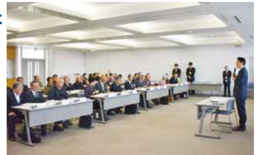
▲役場で行われた委嘱状交付式の様子

民生委員・児童委員は地域住民の福祉向上のために、民生委員法に基づき厚生労働大臣が委嘱する民間の奉仕者です。生活上の困りごとや各種福祉サービスなどのさまざまな問題について、秘密を厳守し、相談に応じたり助言を行うとともに、地域に密着した福祉の担い手として、行政機関と地域住民のパイプ役として、活動しています。任期は平成28年12月1日から3年間です。