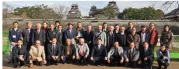
視察団参加者の集合写真