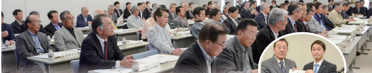
4月6日に行われた区長会総会の様子