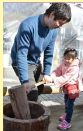
一生懸命餅つきをするお子さんの様子