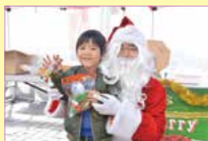
サンタさんと一緒に記念写真

3日には、福袋販売や、豪華賞品が当たるガラポンくじが行われ、道の駅は多くの方で賑わいました。