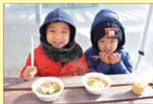
あつあつのお雑煮を食べる子どもたち