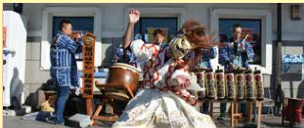
迫力ある舞を披露する新川囃子の皆さん

その他にも道の駅の情報がたくさん！ Instagramで「#道の駅さかい」で検索！