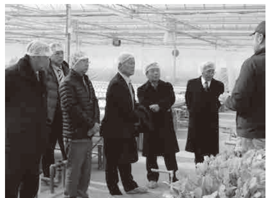
「舞台アグリイノベーション株式会社」及び「みちさき」を視察