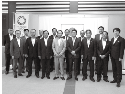
事前キャンプ誘致に向けたナショナルトレーニングセンターの視察