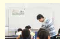
●さかいつ子未来塾推進事業 170万円(総事業費432万円)