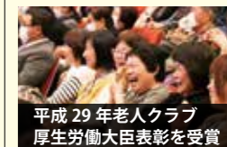
●平成29年老人クラブ厚生労働大臣表彰を受賞 ●いきいき福祉大会事業 746万円