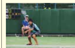
●文化・スポーツ大会等参加助成事業 60万円