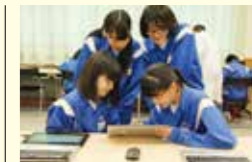
●教育用(中学校)コンピューター推進事業(タブレット型PC導入) 442万円(総事業費885万円)