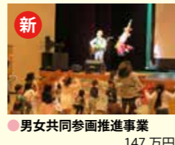
●男女共同参画推進事業 147万円