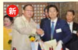
●海外友好都市交流推進事業 305万円