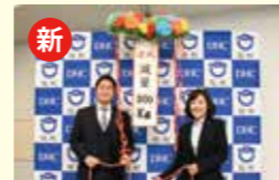
●メタバ脱出減量プログラム事業 159万円(総事業費319万円)