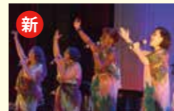
●境町文化協会40周年記念事業 195万円