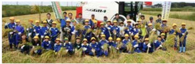
カマを使って自分たちで収穫した稲を手に記念撮影

森戸小学校では、5年生による稲刈りの体験学習を実施しました。ふだんはできない稲刈り体験に児童たちからは「楽しい!」の声が多く上がっていました。その後、実際に精米する様子を見学し、最後に炊きたての美味しい新米を試食しました。