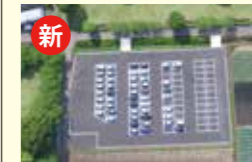
●ふれあいの里管理運営事業(駐車場整備工事・グラウンドゴルフ場内看板設置工事) 2,298万円