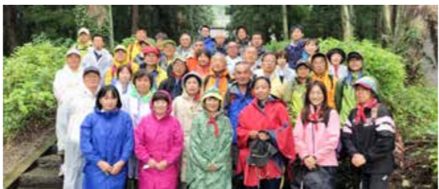
雨の中とはなりましたが、45名の参加でハイキングを楽しみました

境町スポーツ推進委員会では、45名の参加のもと「栃木市太平山ハイキング」を開催しました。この企画は、町民の健康増進とさらなる体力の向上を目的とし、毎年実施されています。ハイキング当日は、あいにくの雨模様となりましたが、参加した方達は、歴史深い太平山の趣と大自然の素晴らしさを満喫していました。