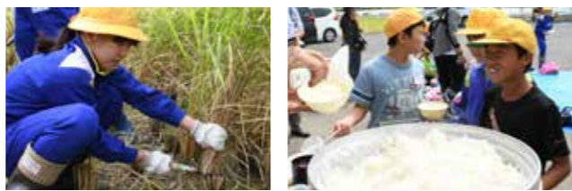
慣れないカマを持ちつつ、上手に稲刈りを行う児童 大きな釜で炊いた新米は格別の美味しさ! 児童36名で完食しました