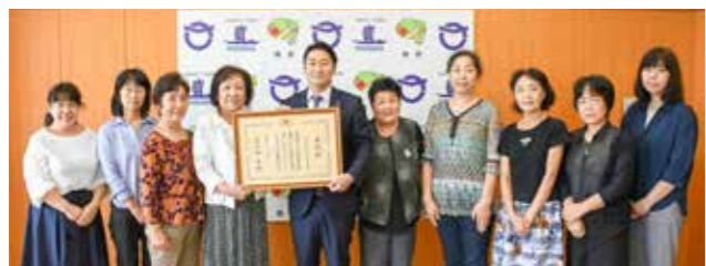
文部科学大臣表彰受賞の報告で来庁したすばるの皆さん

「朗読ボランティアすばる」が子供の読書活動優秀実践団体に関する「文部科学大臣表彰」を受賞しました。すばるは、昭和61年に発足し、現在25名の会員が朗読ボランティアとして活動しています。主に、各小学校における読み聞かせや視覚障がい者への朗読テープの作成配布、公民館図書館における親子で楽しむ朗読会などを行っています。