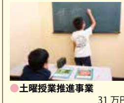
●土曜授業推進事業 31万円