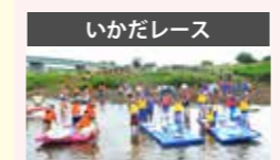
●ふるさと祭り推進事業 800万円