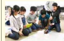
●キッズフューチャーキャンプ事業 300万円