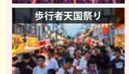
●花火大会バスツアー 300万円