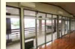
●武道館管理運営事業(空調設備設置工事) 149万円