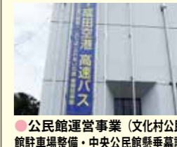
●公民館運営事業(文化村公民館駐車場整備・中央公民館懸垂幕設置工事等) 209万円