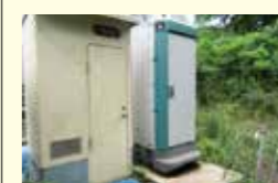
●運動場管理運営事業(大歩グラウンドトイレ設置工事) 117万円