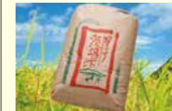
●米農家支援事業 400万円