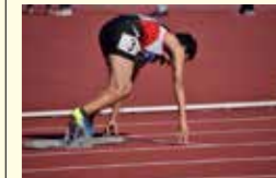
●各種負担金及び補助事業(中学校選手派遣費補助金) 177万円