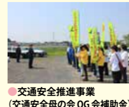
●交通安全推進事業(交通安全母の会OG会補助金) 80万円