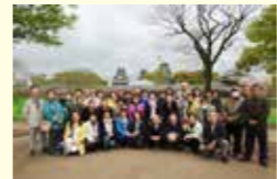
●熊本地震復興支援境町民号 737万円