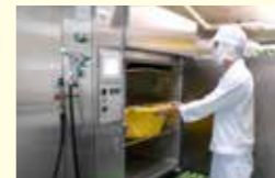
●給食センター管理運営事業(調理機等設置工事) 236万円