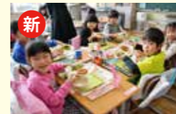
●子育て応援学校給食費補助金交付事業 4,428万円