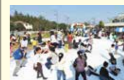
●文化村リノベーション推進事業 1,268万円(総事業費3,768万円)