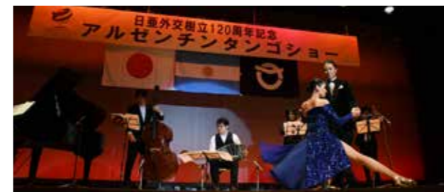
華麗に踊るタンゴショーの様子

タンゴショーの前には、長田小児童による境町とアルゼンチンとの交流の歴史や、10月にアルゼンチン共和国に派遣された児童による体験談の発表が行われました。タンゴショーがはじまると、叙情的な音楽と踊りの融合、きらびやかな衣装に、700名の来場者は魅了され、公演後には多くのご好評の声をいただきました。