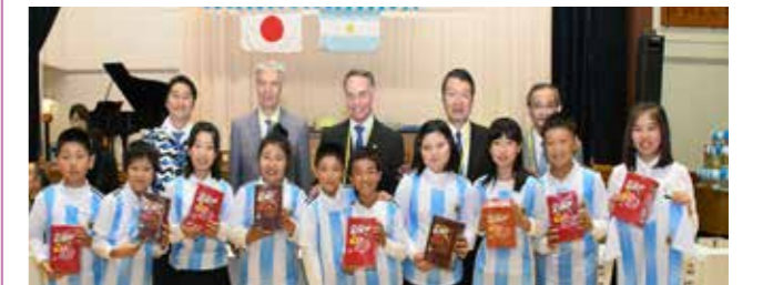
ペロー大使からお菓子のプレゼントを受けとる児童たち