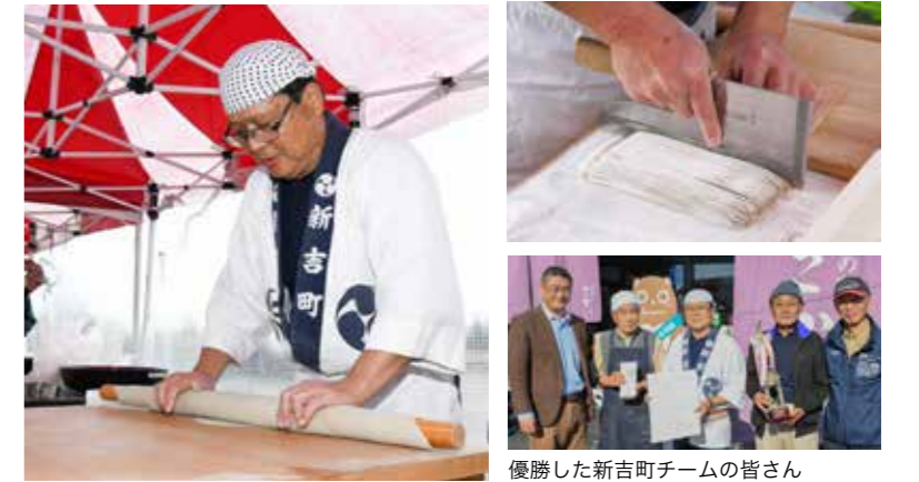
優勝した新吉町チームの皆さん

道の駅さかいにて、新そば祭りが行われました。境町近隣で採れた新そば粉を使用しそば打ち名人を決めるアマチュア参加者限定の選手権「第5回そば打ち名人選手権 in SAKAI」では、4チームが競い合い、投票券を購入した多くのお客様で賑わいました。来場したお客様は、4種類の新そばの味比べをしながら、新そばならではのこしや香りを楽しみました。