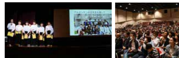
アルゼンチン派遣児童の発表