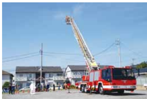
▲ 消防はしご車体験