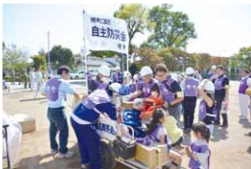
▲ 自主防災組織(行政区)ごとに小学校へ避難