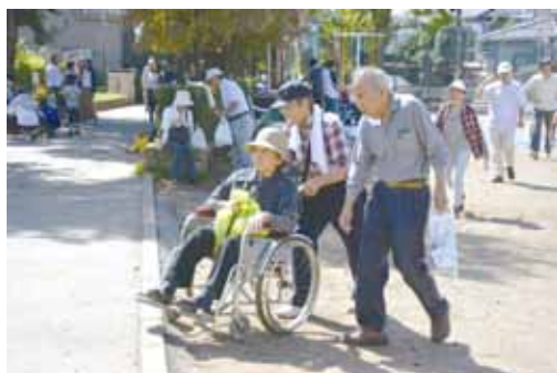
▲ 要配慮者への避難支援訓練