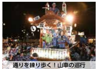
通りを練り歩く! 山車の巡行