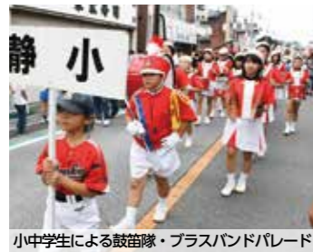
小中学生による鼓笛隊・ brassバンドパレード