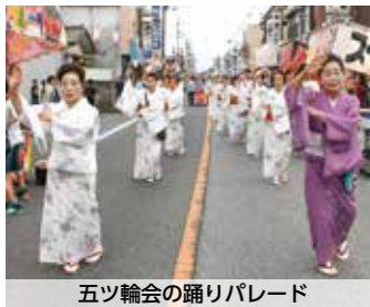
五ツ輪会の踊りパレード