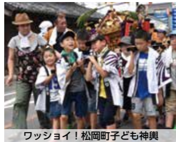
ワッショイ! 松岡町子ども神輿