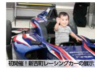
初開催! 新吉町レーシングカーの展示