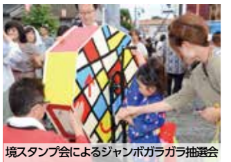
境スタンプ会によるジャンボガラガラ抽選会