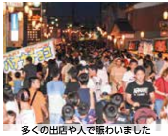
多くの出店や人で賑わいました