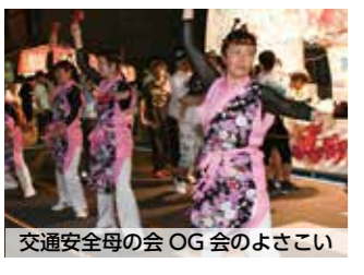
交通安全母の会 OG 会のよさこい