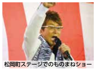
松岡町ステージでのものまねショー