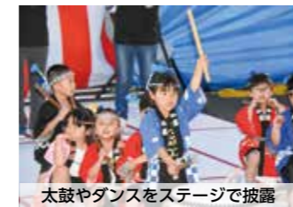
太鼓やダンスをステージで披露