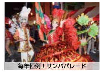
毎年恒例! サンバパレード