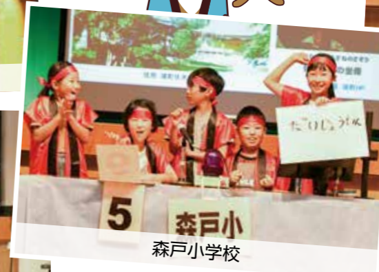
5 森戸小 森戸小学校