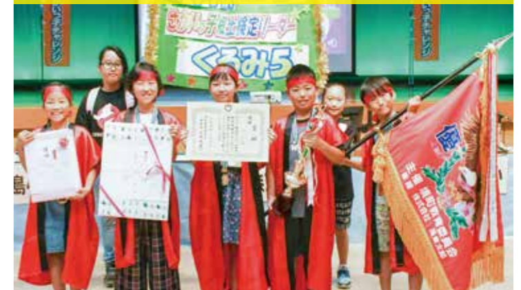
優勝した森戸小学校の皆さん。「最初は負けるかと思いましたが、協力して優勝できてよかったです。休み時間や昼休みも利用し、早押しの練習などもがんばりました」