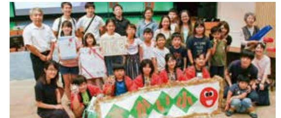
見事な声援でベスト応援賞を受賞した境小学校の皆さん