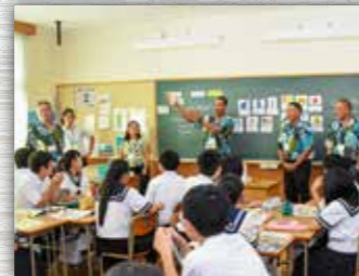
アリアマヌの先生たちが講師役となり英語での質疑応答を行いました