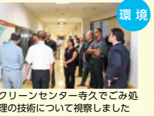
環境 クリーンセンター寺久でごみ処理の技術について視察しました