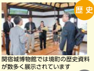
歴史 関宿城博物館では境町の歴史資料が数多く展示されています

9月30日、10月1日の2日間、アリアマヌ中学校の代表団が、ハワイの生徒が境町に来町する際に、町の歴史と文化、名所、環境・工業を学ぶことが出来る施設を視察しました。代表団は各施設において担当者の説明に熱心に耳を傾けており、ハワイの生徒たちにぜひ体験させたいと感想を述べました。