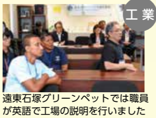
工業 遠東石塚グリーンペットでは職員が英語で工場の説明を行いました