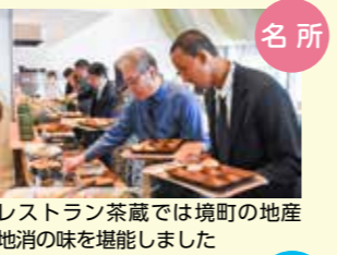
名所 レストラン茶蔵では境町の地産地消の味を堪能しました