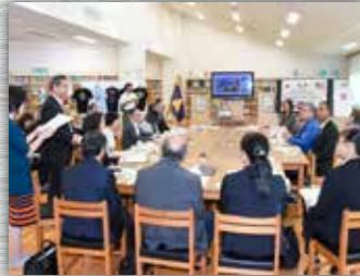
境一中および境小・静小・長田小の校長先生と意見交換を行いました