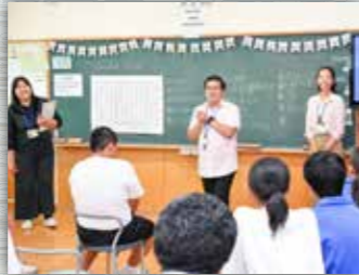
フィリピン人英語講師による英語授業を視察しました