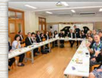
境二中および猿島小・森戸小の校長先生と意見交換を行いました