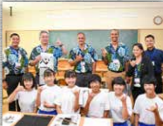
書道体験では生徒が英語でアリアマヌの先生たちに書道を教えました