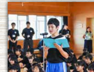
全校生徒による歓迎会では、英語で歓迎のスピーチを行いました