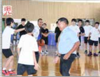
生徒たちと一緒にバスケットボールを楽しみました