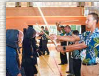
アリアマヌの先生たちは、初めての剣道体験に興味深々でした