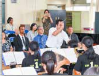
吹奏楽部による演奏会では美しい音色に聞き入っていました