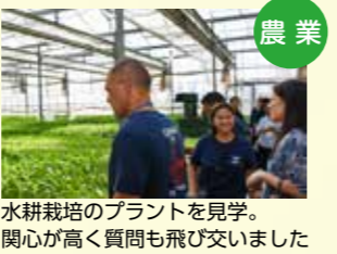
農業 水耕栽培のプラントを見学。関心が高く質問も飛び交いました