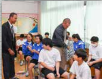
アリアマヌの先生から生徒たちへラバースレットがプレゼントされました