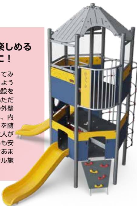
→設置予定のポーンランドの大型遊具

子どもにも大人にも行ってみたい！と思ってもらえるような好奇心を創造させる施設を目指して設計をさせていただきました。杉板の鱗状の外壁をアクセントに取り入れ、内部にもワクワクポイントを随所に考えております。大人が仕事をしやすく、子どもも安心して遊べる安全な施設。このような用途の施設はあまり前例がないため勉強の毎日ですが、境町オリジナル施設を形にするため尽力したいと思います。