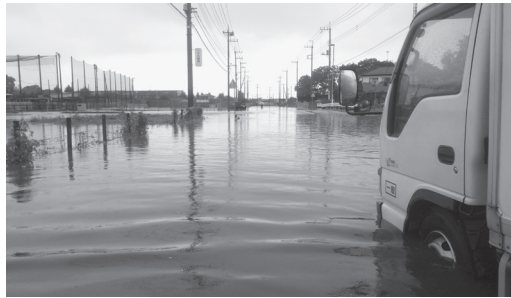
台風等による豪雨時の道路冠水状況

いては、交差点の下にバイパス管を設置したことにより、以前に比べて道路冠水が解消されている。雨水排水計画の現状については、昨年度、社会資本総合整備計画の承認を受けたことから、整備費用に国の補助金を活用し、令和4年度の完成を目標に今後も事業を着実に進め、道路冠水対策に努めていく。(理事兼防災安全課長)