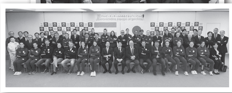
11月27日 アルゼンチン大使館、 11月28日 境町役場にて開催