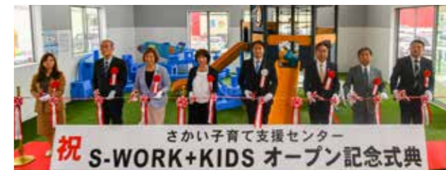
記念式典でのテープカットの様子

これまで対象年齢が3歳未満だった「キッズハウスさかい」の敷地内に小学校低学年までが利用できる施設を新築し、「さかい子育て支援センターS-WORK+KIDS」としてリニューアルオープンしました。新たに増築した施設は、室内に大型遊具やネット遊具、屋外にミニ電動カー乗り場などが設置されています。施設の整備にあたっては、地方創生拠点整備交付金などを活用し、町の財政の負担を減らす工夫をしています。事前登録制のテレワークスペースやフリーキッチンを併設し、子どもを見守りながら仕事ができる環境が境町に誕生しました。