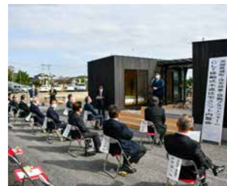
日本初のCLT(直交集成板)技術を活用した移動式木造建築住宅が完成

住友林業株式会社が開発した日本初のCLT(直交集成板)技術を活用した移動式木造建築住宅が、境町に完成し、内覧会が行われました。境町は利根川氾濫時の水害に備え、避難所又は応急仮設住宅等として活用できる、各種の移動式コンテナハウスの導入に取り組んでいます。その中で今年8月に、住友林業株式会社と包括連携協定を締結したことで、このCLT技術とモバイルオフグリッド技術を活用した、移動式木造建築住宅を共同開発研究し、災害時に避難所等として、平時はグランピングの施設として活用していく予定です。