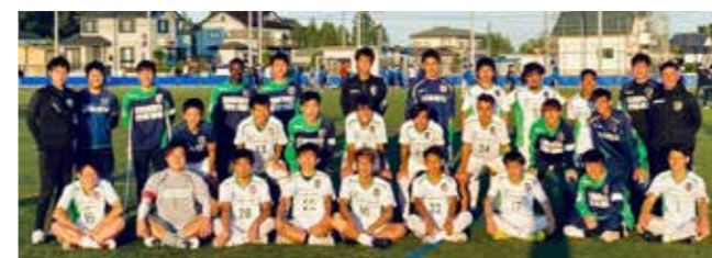
境トリニタスの皆さん