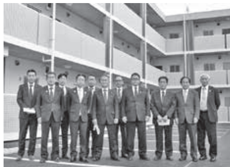
第4弾PFI方式住宅視察の様子