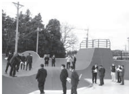
アーバンスポーツパーク視察の様子

第1回定例会中である3月9日、境町総合運動公園地内に整備を進めてきたアーバンスポーツパーク及び定住促進事業における第4弾PFI方式住宅「アイレットハウスひまわり館」の現地視察を行いました。