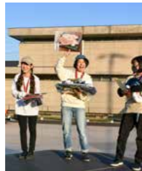
賞品を手にニコリ