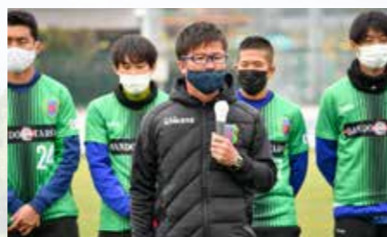
優勝報告を行う真中監督