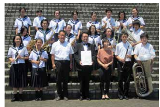
境一中吹奏楽部の皆さん、銀賞おめでとうございます

境一中吹奏楽部が東関東吹奏楽コンクール中学校の部B部門に出場しました。本大会はコロナ禍のため無観客の開催となりましたが、境一中吹奏楽部の皆さんは茨城会場となった、ザ・ヒロサワ・シティ会館で堂々の演奏を披露し、銀賞に輝きました。