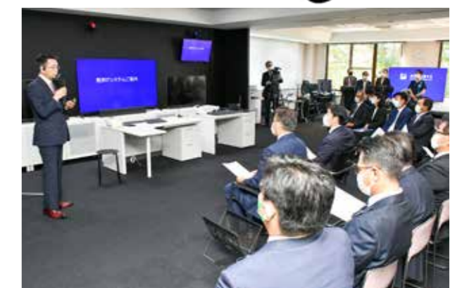
より安全・安心な運行が期待されます