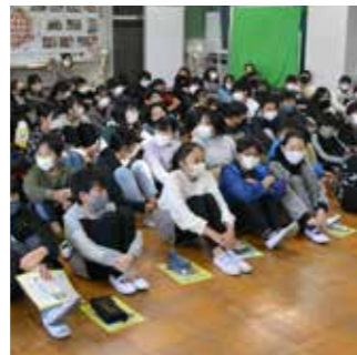
講師の話や児童たち