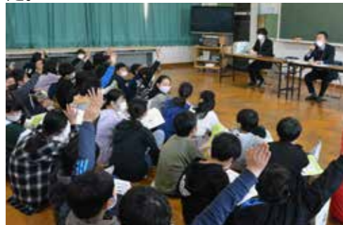
講話やクイズを通して、税について学びました

今回の租税教室を通して、税金が私たちの生活の様々なところに使われていることが分かりました。私たちの通う小学校も税金で建てられていて、もしも税金が無くなったら、自分でそのお金を払う必要があるの、とても大変だと感じました。