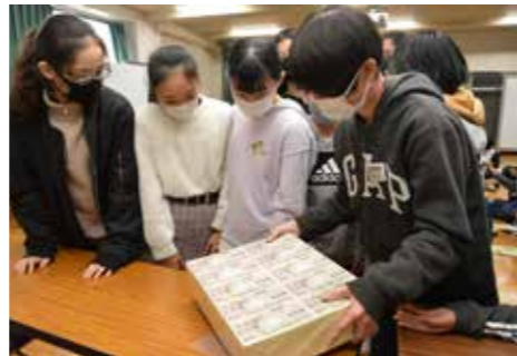
一億円のレプリカを使用した重さ体験