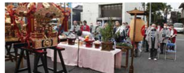
住吉町で行われた神輿の神霊入れ

今までの神輿は、老朽化が著しく、今回宝くじの助成金と地区負担金を併せて修復しました。※宝くじ助成事業は、宝くじの社会貢献広報事業として、宝くじの受託事業収入を財源として実施されている事業です。