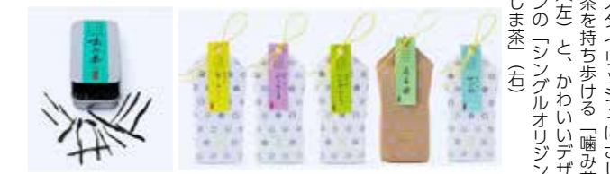
スタイリッシュにさしま茶を持ち歩ける「噛み茶」(左)と、かわいデザイン「シングルオリジンさしま茶」(右)

知事選定の「噛み茶-手揉み茶-」、選定の「シングルオリジン さしま茶」はどちらも、飯田園の高い製茶技術と、スタイリッシュなデザイン、お茶の常識にとられない、ユニークでオリジナリティを感じさせる発想が評価されての受賞となりました。