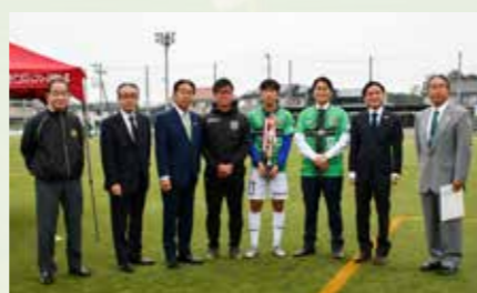
関係者のみなさん