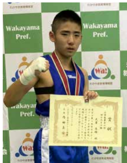
和歌山県立体育館にて