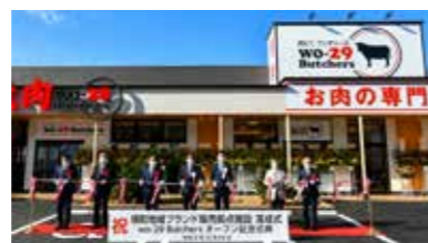
境町に本格的な焼肉店がオープンしました

施設内には、常陸牛や梅山豚、旬の野菜など境町の特産品を販売する物販店舗と、焼肉店「wo-29 Butchers」（おにくブッチャーズ）がオープンし、すぐ隣にある境町サッカー場や境町アーバンスポーツパークなどのスポーツ施設と合わせて、県内外から多くの人が訪れる施設になると期待が寄せられています。