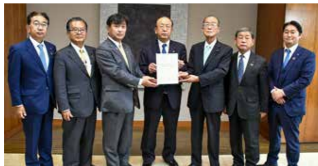
古河境バイパス開通に向けての要望書を提出しました

古河境バイパスは、圏央道境古河インターチェンジと新4号国道を結ぶ路線であり、地域の交流・発展を支える生活道路であるとともに、災害時のライフラインとして極めて重要な役割を担っています。そのため一日も早い古河境バイパスの開通が望まれています。