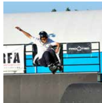
数々の大技が披露されました