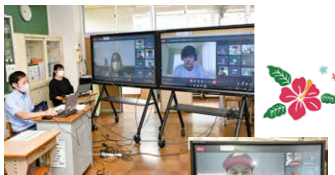
児童たちは質問に答えながら親交を深めました

境町は平成30年9月にハワイのホノルル市と友好都市協定を結び、令和元年12月にはホノルル市のアリアマヌ中学校と境一中・二中が姉妹校協定を締結しています。 境町の小学校でもハワイの小学校との姉妹校協定締結に向け、ホノルル市のノエラニ小学校と境町立境小学校の両校の交流を深めています。9月17日(金)その一環として、オンラインの交流会を行いました。 交流会に参加した境小の6年生は、好きな給食や、人気の映画などの紹介を行い、ノエラニ小の生徒からの質問にも英語で答えるなどお互いに交流を深めました。