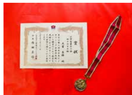
準優勝時の賞状とメダル