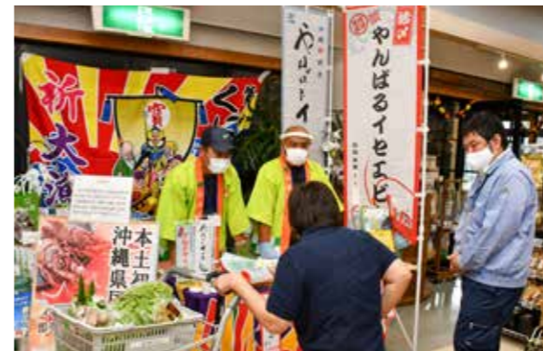
当日は珍しい品々が並んだ海産物販売所