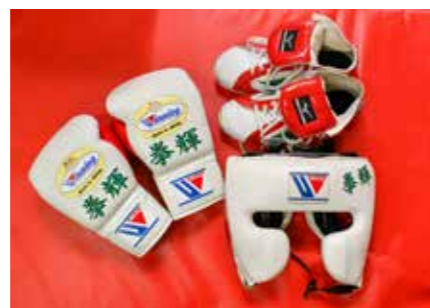
拳輝さん愛用のグローブ、シューズ、ヘッドギア