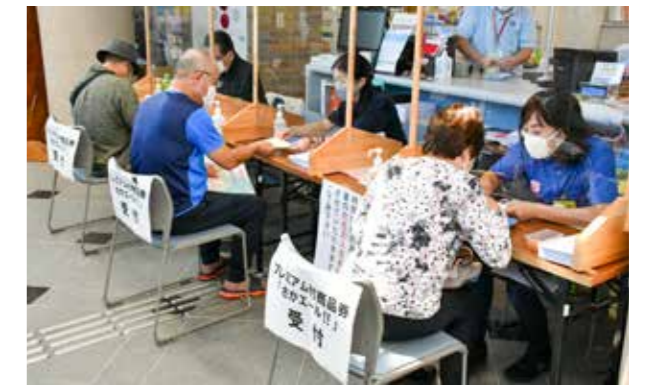
ドライブスルー方式にて整理券を配布し、販売しました