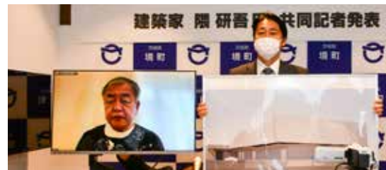
境町サテライトで行われた記者発表の様子