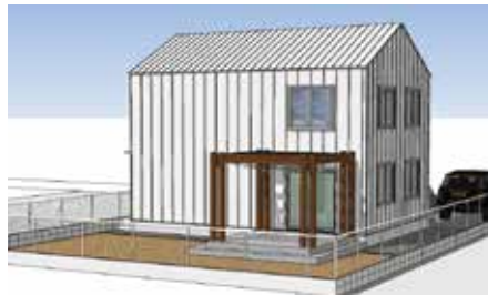
ガレージハウスのイメージ図