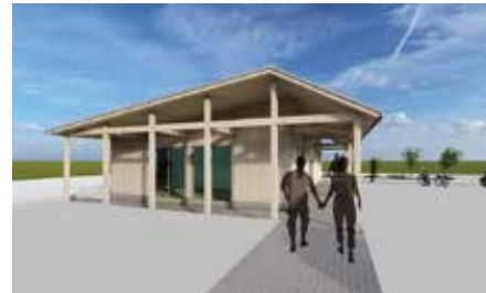
コミュニティ棟のイメージ図