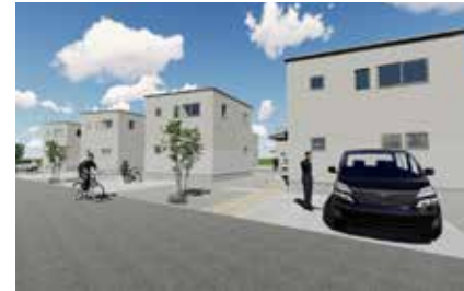
戸建て棟のイメージ図