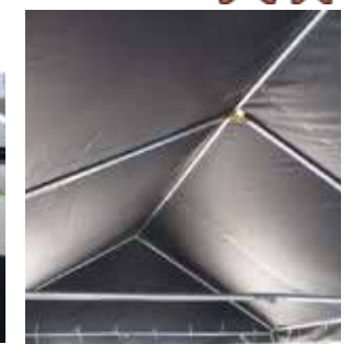
テントの中の様子