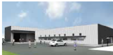
「(仮称) 境町ブランド研究開発拠点施設」のイメージ図