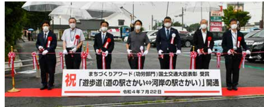
開通式典でのテープカットの様子

遊歩道は、利根川堤防の小段を活用した道の駅さかいから河岸の駅さかいまでの延長約 570m (幅員 2m) です。まちなかウォークアブル推進事業の一環として整備され、まちなかに点在している観光施設等を散策するための歩道が少ないことから、町への来訪者を安全にわかりやすく散策できるようにするため、回遊性を持たせた歩行空間を創出しました。周遊ルートを確認し、まちの賑わい創出に貢献したことが高く評価され、境町が 2022 年度まちづくりアワード (功労部門) 国土交通大臣表彰を受賞しました。