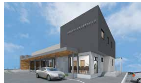
開院する医院のイメージ図