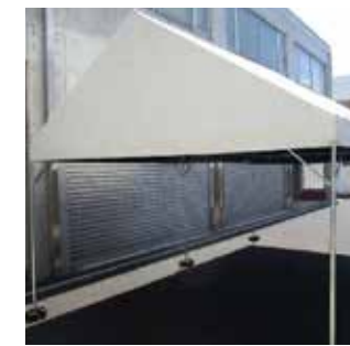
遮光効果 100%サマーシールド