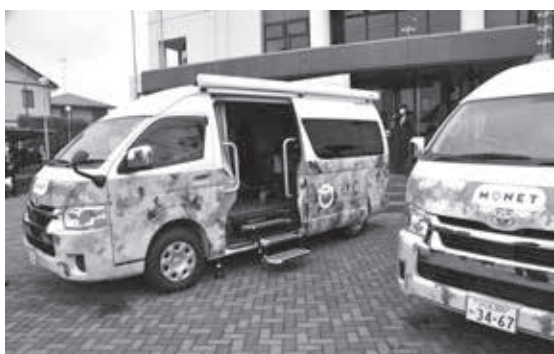
マルチタスク車両披露 検診サービスのデモンストレーションの様子