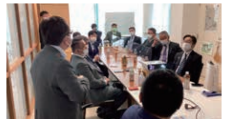
沖縄物産企業連合への視察