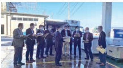
国頭漁業協同組合への視察

国頭村長や国頭村議会議員と境町議会議員の交流の場が持たれたことにより、今後更に両町村議会の友好を深め、両町村発展に向け連携した事業を推進して参りたいと思っております。今回の視察に当たり国頭村関係者の皆様に熱心に対応していただき、この場を借りて厚くお礼申し上げます。