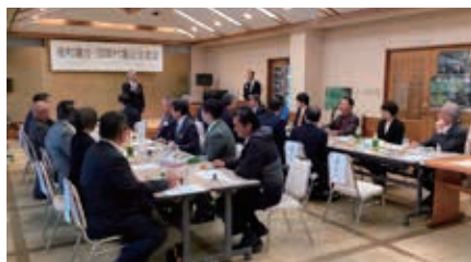
国頭村議会との交流会