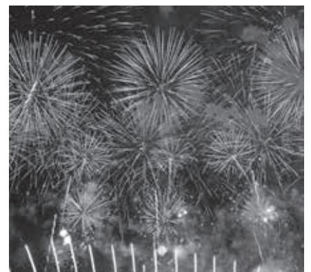
第35回利根川大花火大会