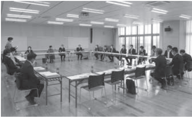
土浦市立新治学園義務教育学校への視察