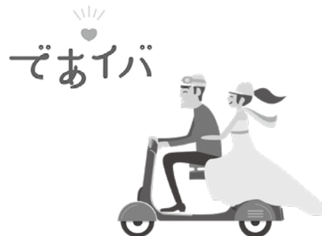
図 1 いばらき出会いサポートセンター(水戸センター)

「であいバ」は、AIがお相手をマッチングします！ 入会の際に登録するプロフィールや価値診断テスト(全112問の質問)の結果をもとに、AIが相性のよい相手を紹介します。