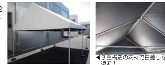
3重構造の素材で日差しを遮断！

【サマーシールドテント効果】 紫外線遮蔽率：99%以上 遮光効果：100% クーリング効果：-4℃以上