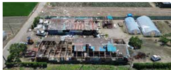
屋根が飛ばされた豚舎

町内では、11日(火)午後7時ごろ突風による被害が発生し、外壁・瓦及びガラスの破損のほか倒木などの被害が多数見受けられました。この際、建設業協会境支部の協力を得て、住家の屋根の防水処置や通行を阻害する倒木の撤去など応急災害対策を行いました。