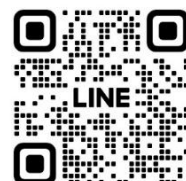
ママのからだほぐし