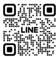
ママのからだほぐし