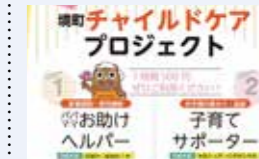
● 産前産後子育てヘルパー派遣事業 35万円