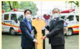
● 国際交流推進事業 2,937万円