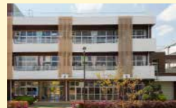
● 学校施設維持管理事業 1,254万円