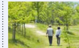
● 歩活プロジェクト事業 465万円