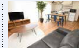
● 移住・定住促進民間賃貸住宅家賃助成事業 156万円