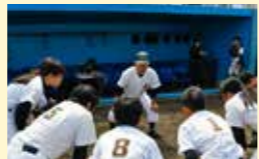
● 文化・スポーツ大会等参加助成事業 17万円