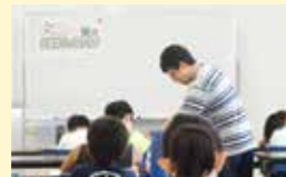
● さかいっ子未来塾推進事業 43万円