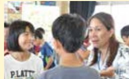
● スーパーグローバルスクール事業 5,228万円