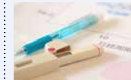
● 特定不妊治療費助成事業 93万円