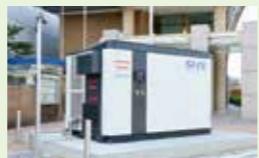
● 水素エネルギー推進事業 97万円