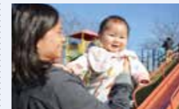
● 医療費助成事業(マル境) 3,761万円