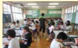
● 放課後子ども教室推進事業 103万円