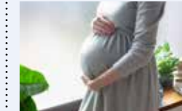
● 妊娠・出産包括支援事業 92万円