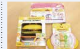
● 新生児記念品給付事業 56万円