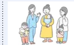
● 子ども・子育て支援事業 148万円