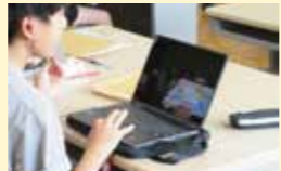
● GIGAスクール推進事業 1,393万円