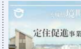
● 定住化促進事業 257万円