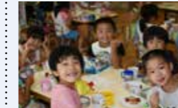
● 保育園・認定こども園副食費・主食費無償化補助事業 2,417万円