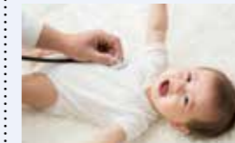
● 産婦・乳児健康診査事業 98万円