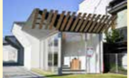
● アートのまちづくり推進事業 600万円