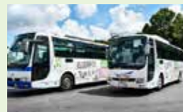
● 公共交通ネットワーク構築事業 4,185万円