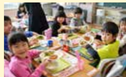
● 子育て応援学校給食費補助金交付事業 4,643万円