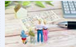
● 子育て世帯等定住促進事業 1,623万円