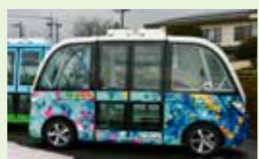
● 自動運転バス運行事業 5,723万円