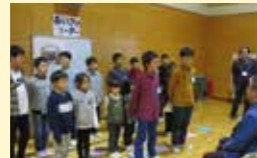
● 7つの習慣小学導入推進事業 110万円