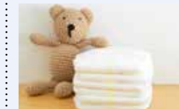
● 赤ちゃん紙おむつ等購入費助成事業 462万円