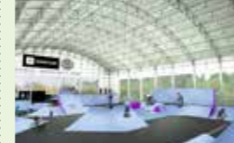
● アーバンスポーツパーク2nd整備事業 789万円