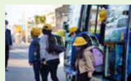
● 自動運転バス活用事業 650万円