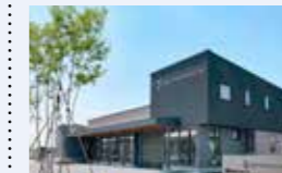
● 医療施設整備事業 5,527万円