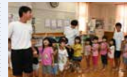
● 第2子以降保育料無償化事業 1,368万円