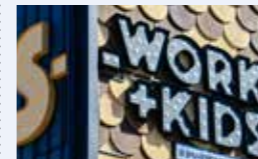
● さかい子育て支援センター運営事業 935万円