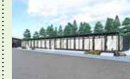
● S-デポ整備事業 485万円