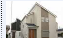
● 移住促進奨励金事業 539万円