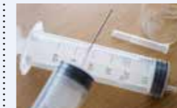
● 子育て応援予防接種拡充事業 126万円