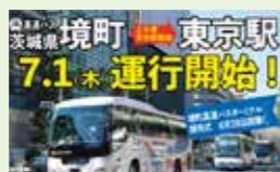
● 通学高速バス定期券購入費助成事業 41万円