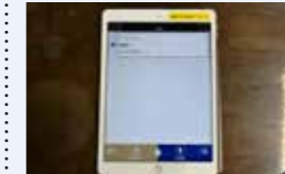
● 外国人一元的相談窓口設置事業 178万円