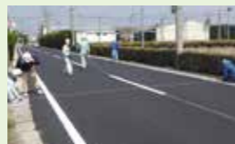
● 道路ストック整備事業 3,284万円