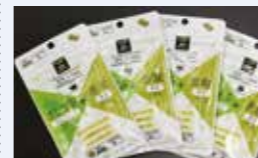
● 葉酸サプリプロジェクト事業 461万円