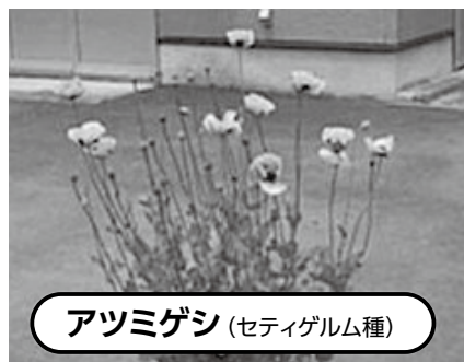
アツミゲシ (セティゲルム種)

植えてはいけないけしは、法律で栽培、所持が禁止されています。この時期、けしは花を咲かせます。自生、栽培している不正大麻、けしを見つけたときは、最寄りの保健所へ連絡してください。