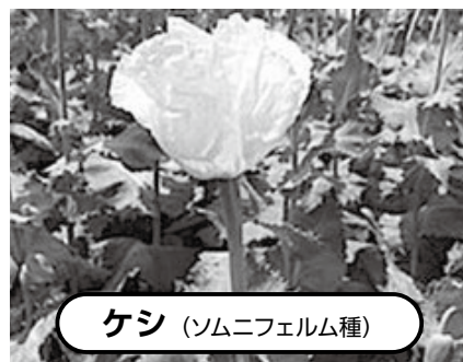
ケシ (ソムニフェルム種)